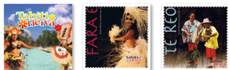
Tahiti Heiva in Japan vol. 1

タヒチより招へいたアーティストが、日本国内でレコーディングしたオリジナルアルバム