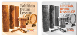
Tahitian Drum Lesson vol. 1

タヒチアンドラムを練習するための教則CD (タヒチより招へいたアーティストが日本国内でレコーディング)