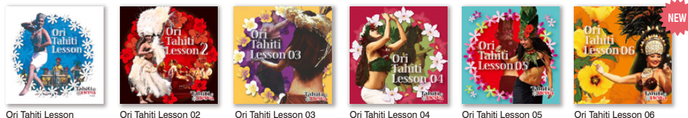
Ori Tahiti Lesson

タヒチアンダンスを練習するための短い分数のドラムを集めたCD (タヒチより招へいたアーティストが日本国内でレコーディング)